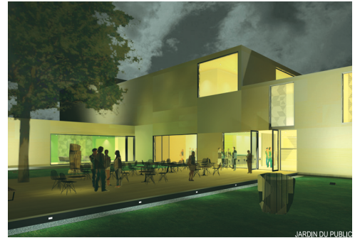
JARDIN DU PUBLIC