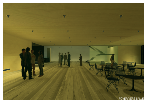
FOYER VERS SALLE