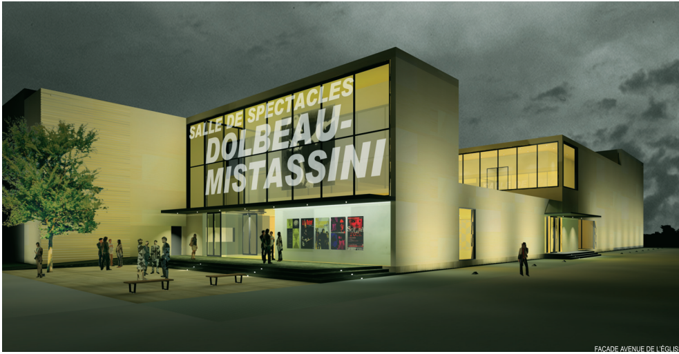
FAÇADE AVENUE DE L'ÉGLISE